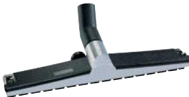
Extrem robuste Metallboden-düse 450 mm. Art.-Nr. 102051

Edelstahl-Saugrohre 2 x 0,5 m, ø 38 mm, Saugschlauch 3 m, Fugendüse und Rundpinzel, Nassbodendüse 450 mm, Trockenbodendüse 450 mm, HEPA 13 Feinstaub-Filterpatrone, Vliesfiltertüte, Zykloneinsatz, , Netzkabel 10 m, schwarz