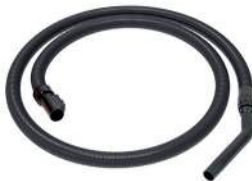
Saugschlauch, 3 m antistatisch. Waterking Art.-Nr. 109112 Waterking XL Art.-Nr. 102116