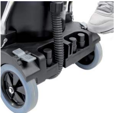
Die Feststellbremse kann beidseitig betätigt werden und verhindert ein ungewolltes Wegrollen des Saugers.