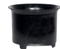
Zykloneinsatz zum Nasssaugen.

Durch den Drall am Einlassstutzen wird der Sprühnebel an der Behälterwand abgeschieden. Zusätzliche Filterstoffe sind nicht mehr notwendig. Die zuverlässige Schwimmerabschaltung reagiert selbst bei extremer Schaumbildung. Seitliche Kühl-Luftschlitze sorgen für konsequente Trennung von Kühl- und Prozessluft.