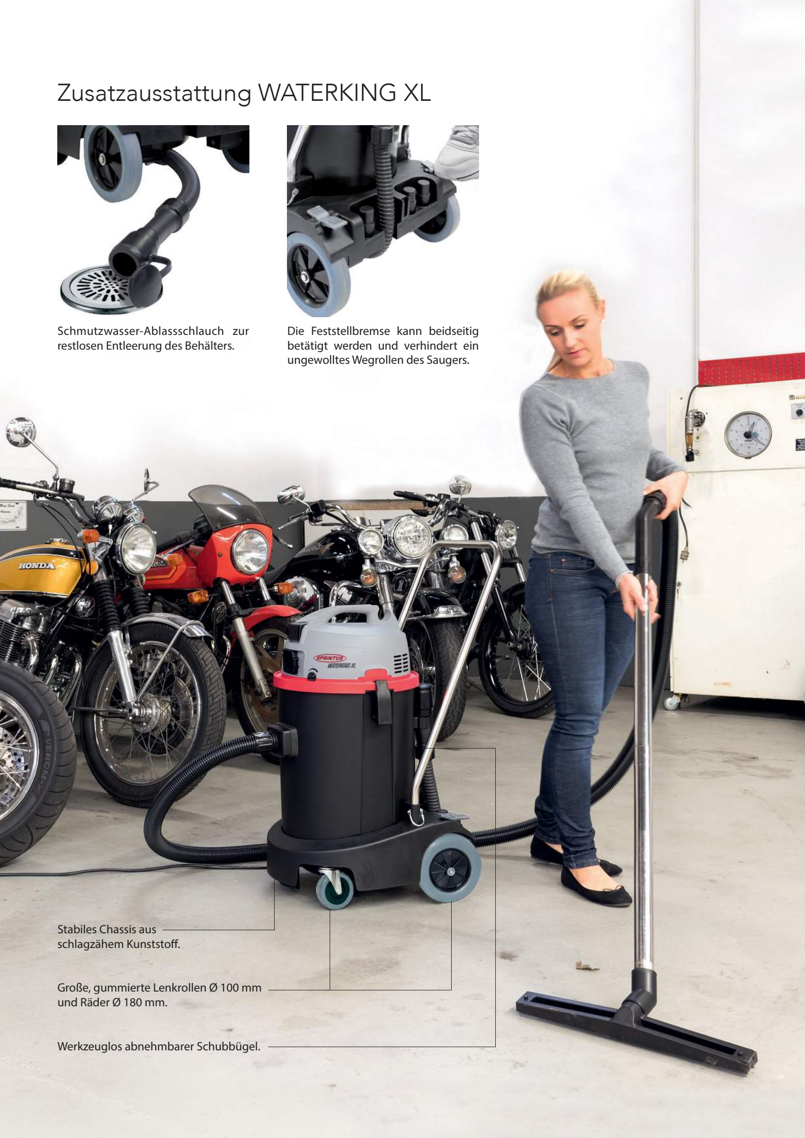
Stabiles Chassis aus schlagzähem Kunststoff.