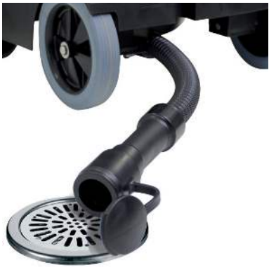
Schmutzwasser-Ablassschlauch zur restlosen Entleerung des Behälters.