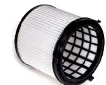
HEPA 13 Feinstaub-Filterpatrone zum Trockensaugen.